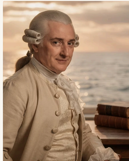
David Hume (1711–1776)