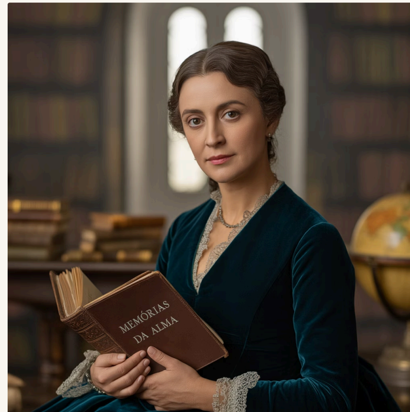
Pioneira da literatura afro-brasileira

A obra apresenta personagens negros com dignidade e humanidade, contrastando com a literatura da época que os retratava de forma estereotipada. Firmina antecipa o movimento abolicionista ao mostrar o sofrimento e a resistência dos escravizados.